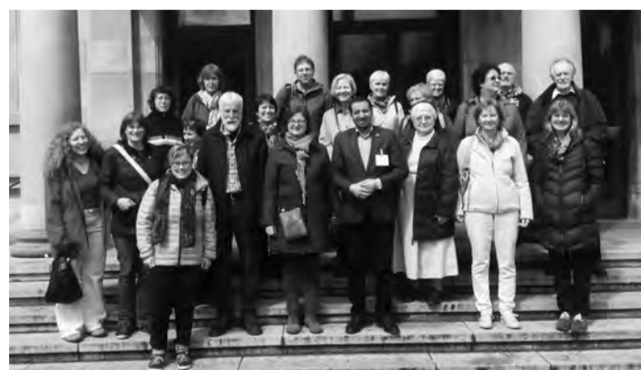
Religiöse Radikalisierung oder Suche nach einer Theologie des Zusammenlebens? 25 Teilnehmerinnen und Teilnehmer stellen sich zentralen Zukunftsfragen

25 Teilnehmerinnen und Teilnehmer aus den Diözesen Augsburg und Rottenburg-Stuttgart tauchten vom 15. bis 17. April 2016 in