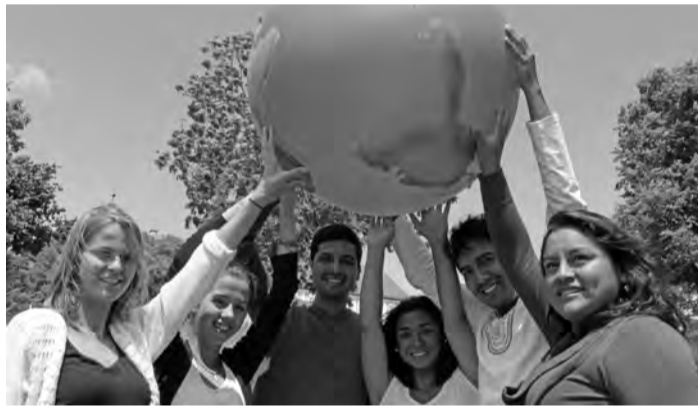
Teilen verbindet: eine gemeinsame WeltSicht schafft Solidarität über Grenzen und Kontinente hinweg

Der Diözesane Weltkirchliche Friedensdienst und die Online-Redaktion der Diözese Rottenburg-Stuttgart starten im Juli eine gemeinsame Themenwoche unter dem Titel „WeltSicht teilen“. Die drs.de-Themenwochen sind inspiriert vom Diözesanpatron Sankt Martin, der im Jahr 2016 seinen 1700. Geburtstag feiert.