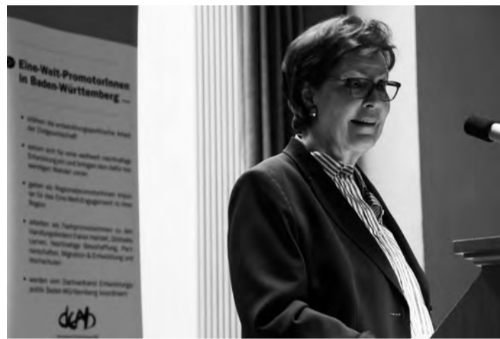
Sie brennt noch immer für das Anliegen eines gerechten globalen Zusammenlebens: Bundesministerin a. D. Heidemarie Wiecek-Zeul in Biberach

Zum Auftakt mahnte die frühere Ministerin für wirtschaftliche Zusammenarbeit und Entwicklung, Heidemarie Wiecek-Zeul, eine selbstkritische Diskussion darüber an, welche Fluchtursachen „Made in Europe“ seien. Nur wenn die reichen Länder ihren verschwenderischen Lebensstil